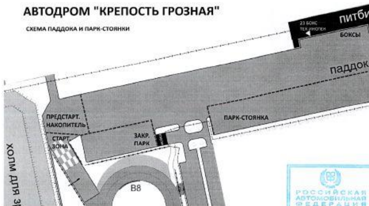
СХЕМА ПАДДОКА И ПАРК-СТОЯНКИ